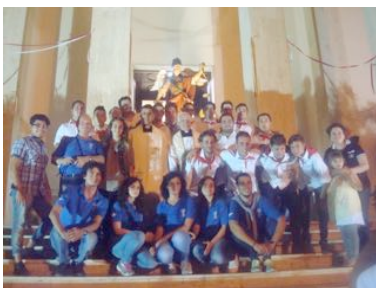
Foto di Gruppo.