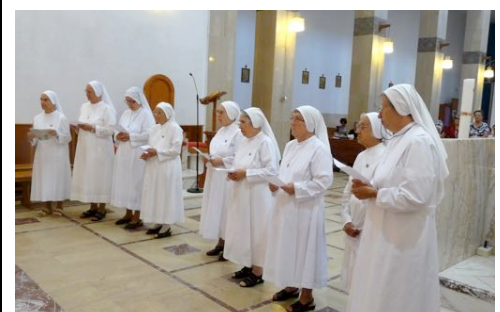
Momento della celebrazione