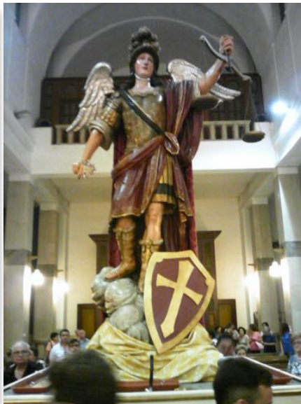
"Scinnuta" di San Michele