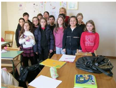
Ragazzi 2 anno comunione e il sito

L'ora di catechismo è un gesto d'amore che la Chiesa rivolge ai ragazzi che incontrano GESU'. " ..dove sono due o tre riuniti nel mio nome, lì sono Io in mezzo a loro" (Mt 18,20). La preparazione di un incontro di catechismo richiede cura e scrupolo ed ogni catechista deve chiedersi: " come posso attirare l'attenzione dei ragazzi? " Vincente è stata, sicuramente, l'idea di presentare, durante l'incontro del 12 febbraio, ad un gruppo di ragazzi del