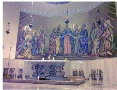
Serata Giona 17 12 2010 Adorazione

Continua lo svolgimento del piano pastorale 2010-2011 e questa volta con una serata tutta incentrata sul coraggio, il coraggio di non arrendersi, di non mollare, ma anche quello di amare.