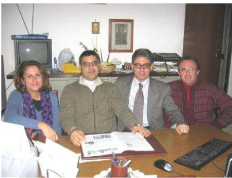
Il gruppo della redazione di "...In Cammino"

Con questo numero si completa il primo anno di pubblicazione de "...In Cammino", il nostro giornalino parrocchiale. E' la nostra "prima candelina" e per festeggiare l'evento abbiamo deciso di parlare un po' di noi. Il modo migliore per farlo è quello di dare un po' di numeri. Nel primo anno abbiamo pubblicato 10 numeri del giornale, nei quali hanno trovato posto 63 articoli scritti da 20 collaboratori, 5 poesie composte da 4 poeti, gli editoriali del Parroco, la