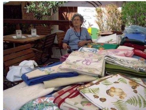
Esposizione biancheria del Banco di beneficenza

Come programmato, il Gruppo di Volontariato Vincenziano della parrocchia ha tenuto ad Erice il banco di beneficenza di biancheria per la casa realizzata dalle