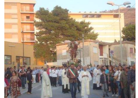
Processione di San Michele