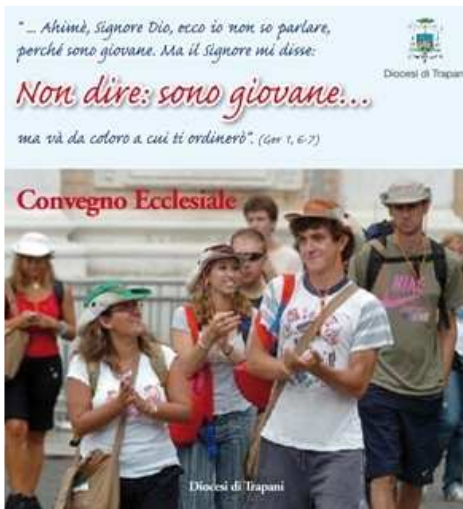
Locandina del convegno

Si è svolto ad Erice dal 29 al 31 Agosto l'annuale Convegno Ecclesiale diocesano sul tema "Non dire sono giovane" al quale hanno partecipato presbiteri, appartenenti ad organismi di partecipazione ecclesiale diocesani, operatori pastorali delle parrocchie, gruppi, movimenti e associazioni. Nel convegno è stata approfondita l'esperienza di Chiesa, "grembo vitale in cui nasce e matura la vita di fede, la nostra partecipazione alla vita di Dio".