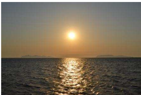
Tramonto con le Egadi

Giunti, ormai, alla conclusione del tanto atteso periodo estivo, è doveroso soffermarsi un po' ad analizzare questo tempo di "vacanza". Spesso, quando si pronuncia il termine vacanza, si è soliti identificarlo con un periodo contrassegnato dal motto "dolce far niente", quindi, dedicato