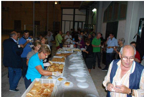
Momenti comunitari della serata "Cantando e ... mangiando"